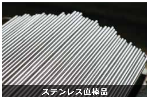
ステンレス直棒品